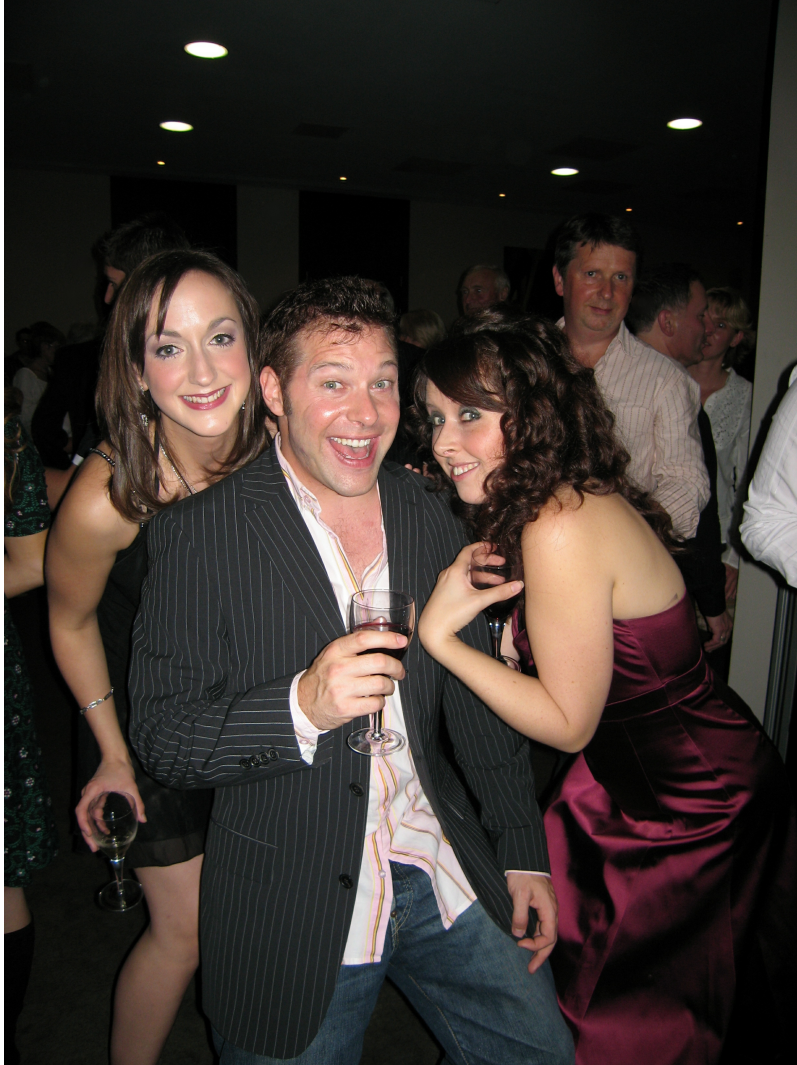
Abbildung 1: In der Zeit des Emerging Adulthood bzw. im jungen Erwachsenenalter wird im Durchschnitt am meisten Alkohol konsumiert; Bildquelle: [9], lizenziert unter einer Creative Commons Namensnennung 2.0 Deutschland Lizenz .

Risikantes Verhalten im Straßenverkehr tritt häufiger im jungen als im mittleren Erwachsenenalter auf, da jüngere Fahrzeugführer unerfahrener sind, sie problematisches Fahrverhalten als weniger riskant bewerten und bei ihnen riskantes Fahrverhalten positivere Gefühle auslöst [10].